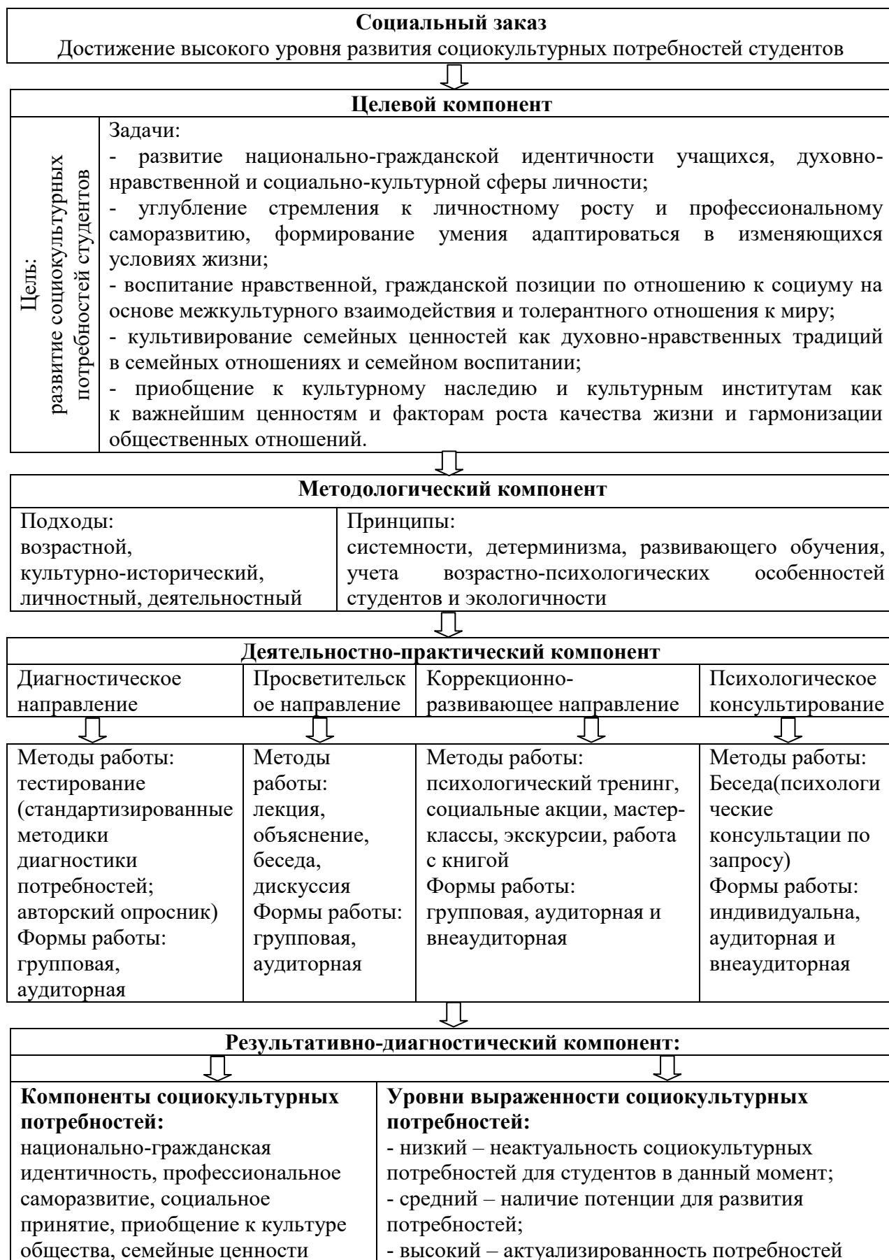
Рисунок 1 – Модель психолого-педагогического сопровождения развития социокультурных потребностей студентов