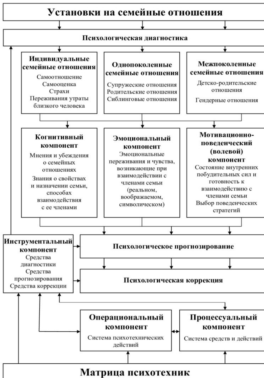
Рисунок 1 – Модель психологического воздействия на семейные установки

на семейные отношения у женщин, осужденных за преступления насильственного характера, и модель психологического воздействия на семейные установки (рисунок 1).