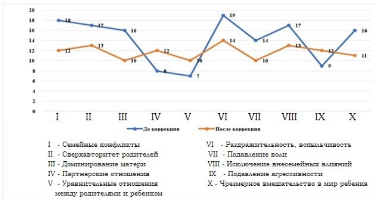
Рисунок 2 – Изменение количественных показателей по шкалам опросника PARI, отражающим установки на семейные отношения женщин ЭГ после психокоррекционного воздействия

В ходе занятий удалось помочь участникам эксперимента отреагировать и пережить некоторые негативные воспоминания из детства, насыщенные чувствами грусти, печали, гневом и страхом, вследствие чего у них появилась идея о возможности создания собственной благополучной семьи. Частично снизилась тревога от мыслей о взаимодействии со значимыми людьми.